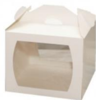
Коробка для торта с 2 окнами 25x25x20 см

На примере данной коробки рассмотрим схему сборки коробок.