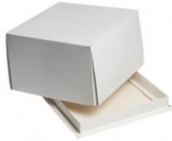
Коробка для торта 17x17x10 см, Pasticciere

На примере данной коробки рассмотрим схему сборки коробок.