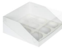
Коробка на 9 капкейков 23,5x23,5x10 см