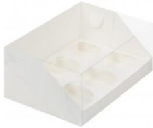
Коробка на 6 капкейков 23,5x16x10 см