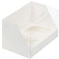
Коробка на 2 капкейка 10x16x10 см