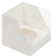
Коробка на 1 капкейк 10x10x10 см

На примере данной коробки рассмотрим схему сборки коробок.