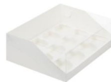
Коробка на 12 капкейков 31x23,5x10 см