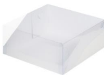
Коробка для десертов 23,5x23,5x10 см